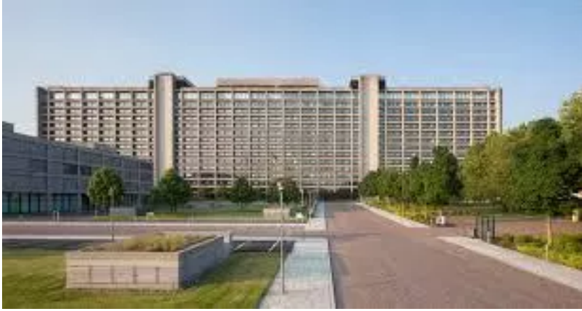
Deutsche Bundesbank: Endlich die volle Wahrheit über die Erzeugung von Geld aus dem Nichts bei der Kreditvergabe

gewährten Kredit als Forderung an den Kreditnehmer, auf der Passivseite ihrer Bilanz schreibt sie dem Kreditnehmer den Kreditbetrag auf dessen Konto als Sichteinlage gut.“